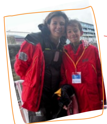
2025 3 e rêve Baptême IMOCA Association Petits Princes Quéguiner