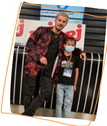
2021 1 er rêve Concert NRJ MUSIC TOUR