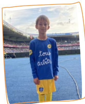
2022 2 e rêve Escort KID au Parc des Princes